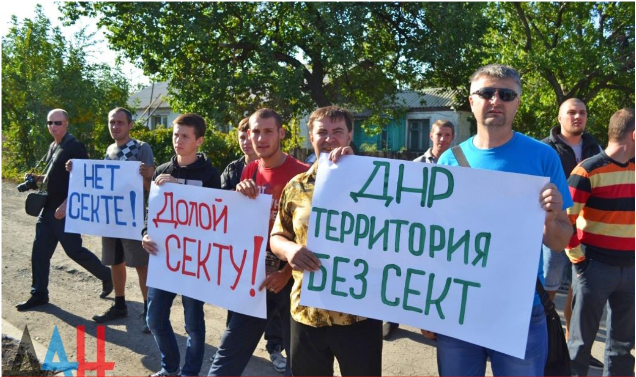
Окупаційна влада “ДНР” організувала мітинг проти “сект” біля молитовного будинку християн-баптистів у місті Шахтарськ Донецької області, 29 вересня 2015

Найбільш жорстоким з відомих фактів був у часи окупації Слов'янська Донецької області, коли бойовиками “ДНР” командував російський відставний офіцер, полковник ГРУ РФ Ігор Гіркін (Стрелков). 8 червня 2014 року група бойовиків “ДНР”, погрожуючи зброєю, одразу після богослужіння арештувала двох старших синів пастора Церкви християн віри євангельської Преображення Господнього – Альберта і Рувима Павенко, а також ще двох дияконів цієї Церкви – Віктора Бродарського і Володимира Величка. Наступного дня сепаратисти зімітували їхню загибель нібито від обстрілу українських військових, підірвавши всіх разом з гранатомету в одному з автомобілів, а тих, хто вижив, – розстріляли з близької відстані.