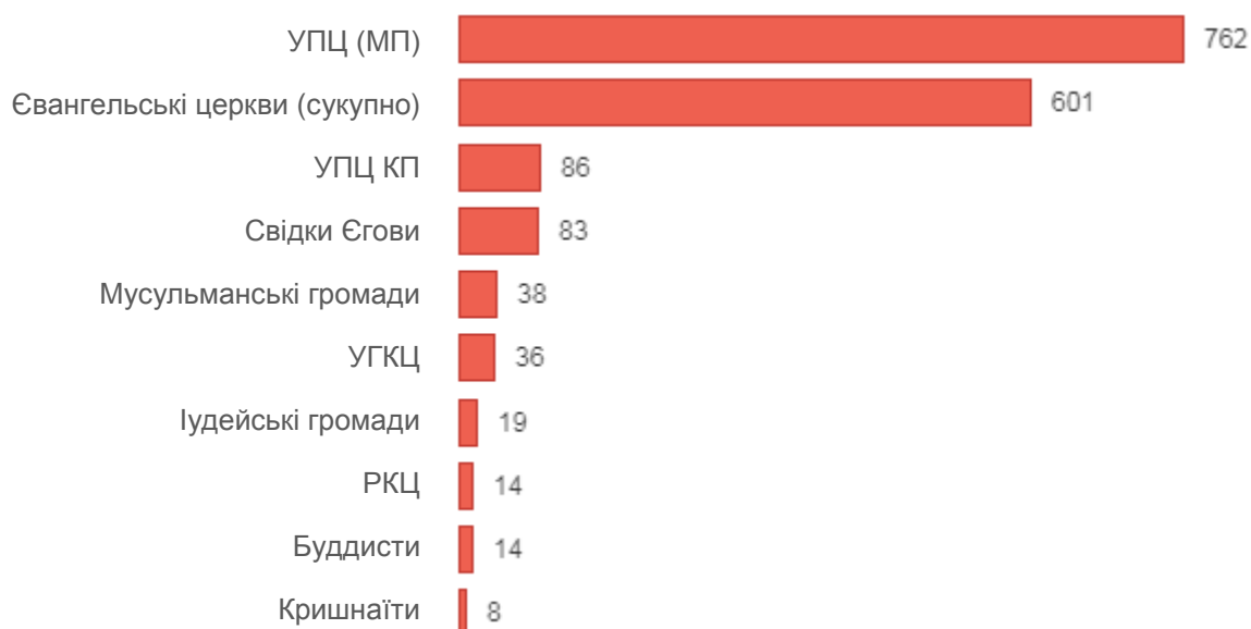
Конфесійна структура релігійних громад Донецької області на початок 2014 року

Релігійне багатоманіття було притаманне і регіонам Східної України. Згідно з офіційною статистикою на початок 2014 року (до російської окупації) в Донецькій області налічувалось 1797 релігійних організацій. З них: 762 – парафії УПЦ Московського Патріархату, 366 – церкви євангельських християн (п'ятидесятники, харизмати та інші), 186 – церкви християн-баптистів, 86 – парафії УПЦ Київського Патріархату, 83 – громади Свідків Єгови, 49 – церкви адвентистів сьомого дня, 38 – мусульманські громади, 36 – греко-католицькі парафії, 19 – іудейські громади, 14 – парафії Католицької Церкви, 14 – буддистські та 8 – кришнаїтські громади.