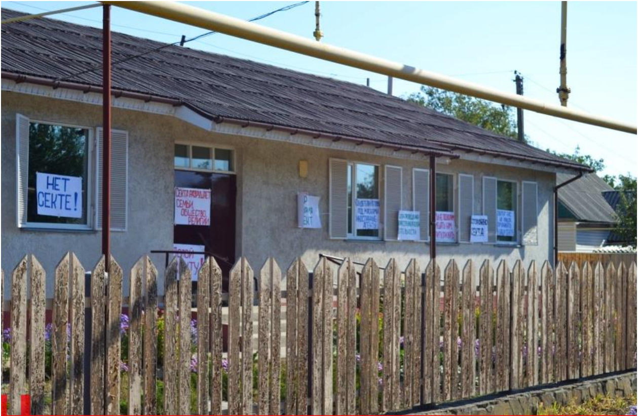
На молитовному будинку християн-баптистів залишили ворожі написи та заклики забиратися геть (м. Шахтарськ Донецької області, 29 вересня 2015)

Такого роду залякування відбувалося і в Донецьку, і в Луганську: пасторів євангельських церков арештовували, били, імітували розстріл та катували в інший спосіб, вривалися в їхні приватні помешкання та влаштовували обшуки. У кращому випадку їх спонукали добровільно виїхати за межі окупованих територій. У такий спосіб окупаційна влада, підтримувана Росією, добивалася повного контролю над мирним населенням. Євангельські християни сприймалися, як вороги, “західні шпигуни”, “агенти” ЦРУ чи СБУ – тобто як загроза для окупаційної влади. Крім цього, бойовиками керують корисливі мотиви, адже у більшості випадків релігійні переслідування на Сході України тісно пов’язані з прагненням заволодіти церковним майном – нерухомістю та коштовною звуковою апаратурою, автомобілями віруючих та іншими цінностями.