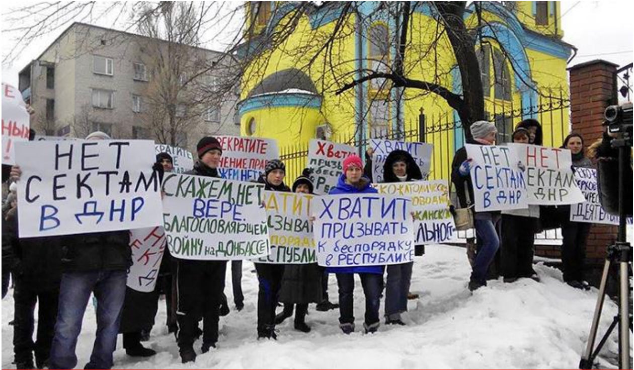
Окупаційна влада "ДНР" організувала мітинг проти "сект" біля греко-католицького храму у місті Донецьку, 29 січня 2016