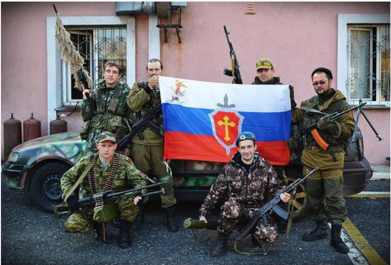
Російські бойовики у складі формування «Руська православна армія» серед перших брали участь в окупації Донецька, 2014

Хоча за період з 2015 року число найбільш жорстоких випадків насильства зменшилася, християнські меншини як і раніше піддаються нападам, образам, штрафам і наклепам з боку окупаційних органів. Інформацію про порушення свободи віросповідання складно отримати, оскільки віруючі побоюються гоніння за скарги в правозахисні організації та іноземні новинні агентства.