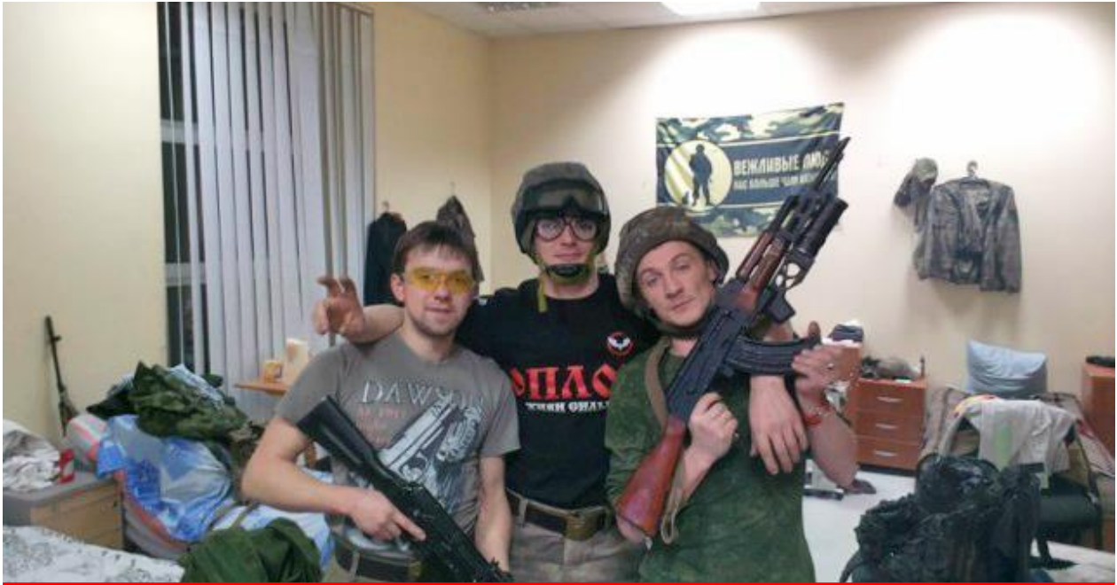
Бойовики “ДНР” розмістилися у приміщенні захопленого Донецького Християнського університету, липень 2014

“Територія віри стала територією ненависті, будинок молитви – вертепом розбійників. Нічого святого для терористів немає. Рахунок захоплених церков йде на десятки” – заявив професор Черенков.